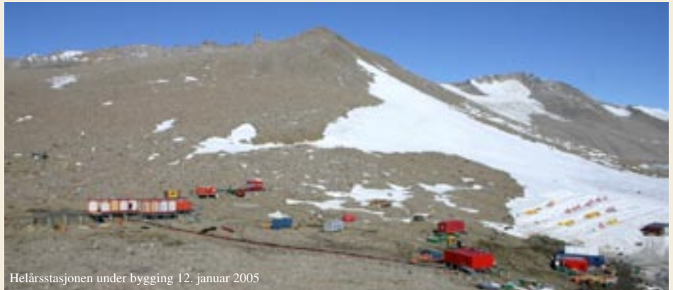
Helårsstasjonen under bygging 12. januar 2005

Troll har plass til opptil åtte personer i den antarktiske vintersesongen og mange flere på sommeren. Selve stasjonen og driften vil oppfylle kravene for vern av miljøet i Antarktis.