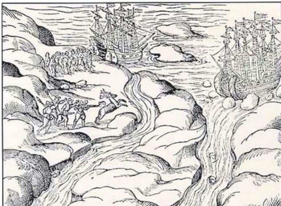
Jens Munks skip i Hudsonstredet, teikna av Jens Munk sjølv. Til venstre ved Caribu Sound, til høgre i Hare Sound. Frå Navigatio Septentrionalis, 1624.

Så kan ein spørje – og det er det fleire av oss i teltet, denne vindstille føremiddagen, som gjer – korleis kunne nokre ekspedisjonar leve i overflod av jakt, medan til dømes Franklins menn omkom alle som ein? Sjølv sagt hadde det noko med kor mange munnar som skulle mettast. Det