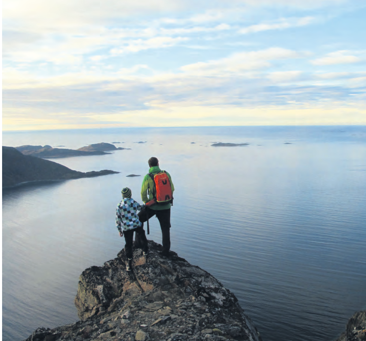
Neste stopp: Nordaust-Grønland. Liten og stor fjellkar blir imponerte av utsikta på veg opp til Brosmetinden på Kvaløya i Troms.

fjells – for dei må ofte dragast –, har kjent på tvilen. Kor hardt skal eg presse? Det er sjeldan evna, men viljen som sviktar. Det veit du. Men kor stor er gleden til poden når me kjem til toppen, saman-